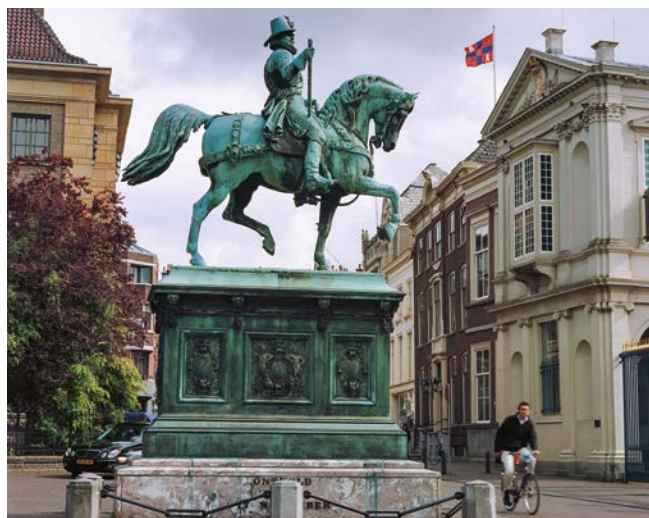
Paleis Noordeinde in Den Haag. L.M. Tangel 2003

Om van bovenaf een ruim zicht op de straat te hebben, creëerden onze voorouders in de middeleeuwen veelhoekige of ronde uitbouwsels van steen of hout boven aan hun huizen en kastelen, vooral op de hoeken. We noemen ze arkels. Wanneer ze een torenachtige bekroning hebben, spreken we over arkeltorentjes of erkertorentjes. Ze zijn nog te zien bij onder andere het vijftiende-eeuwse stadhuis van Veere en het zestiende-eeuwse kasteel Schaloen in Schin op Geul.